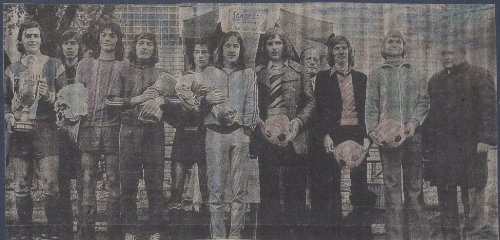
Die Schlacht ist geschlagen: Die Spielführer sämtlicher Mannschaften mit ihren erkämpften Preisen.