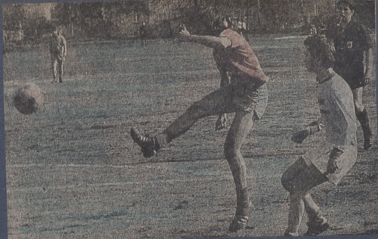
Zwei Szenen aus dem Vorspiel TV 48 – Les Sables.