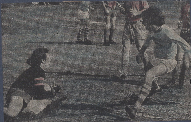
der französische Stürmer scheitert am TV-Hüter.