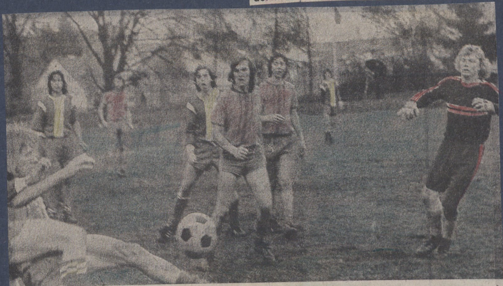
Eine Szene aus dem Endspiel: Die Stürmer von Jahn Nbg. berechnen das Tor des TV 48 Schwabäch.