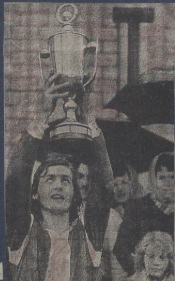
Der Mannschaftskapitän der Nürnberger mit dem Pokal.